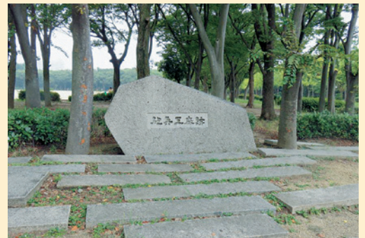
大阪城公園内にある大阪砲兵工廠跡の石碑