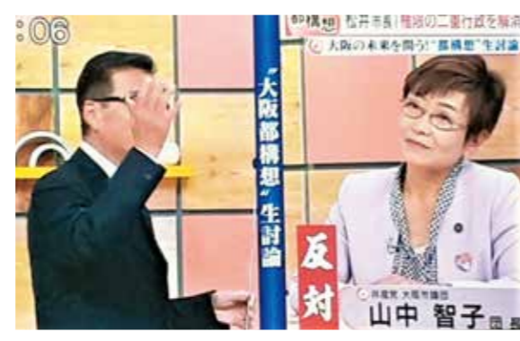
連日くり広げられるテレビ討論。「1300億円コスト」問題、「住民サービス」問題が熱い焦点に